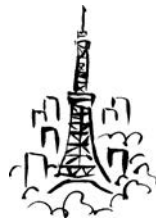
东京 Dōngjīng (東京)