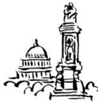
华盛顿 Huáshèngdùn (ワシントン)