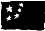
中国 Zhōngguó (中国)