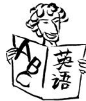
英语 Yīngyǔ (英語)