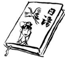
日语 Rìyǔ (日本語)