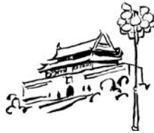
北京 Běijīng (北京)