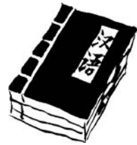
汉语 Hànyǔ (中国語)