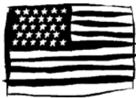
美国 Měiguó (アメリカ)